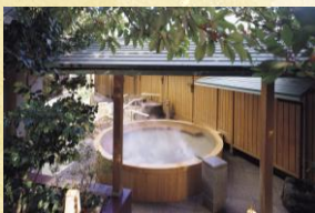
悠幻の湯殿(露天薬湯・露天石風呂)