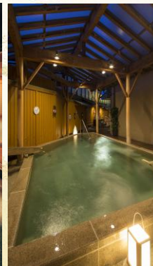
滝見の湯屋(露天石風呂)