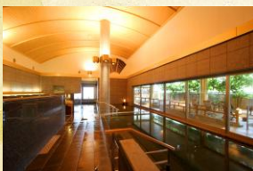
悠幻の湯殿(内湯 むる湯 あつ湯)

あらたに「自家源泉」と引湯源泉の豊富な湯量と鮮度を誇る源泉を 趣の異なる3つの大浴場 男女時間帯入替で「一泊三湯十八ゆめぐり」をお楽しみください