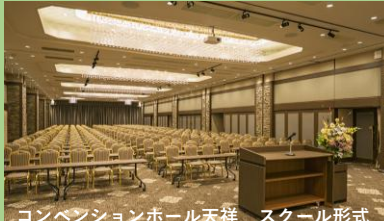
コンベンションホール天祥 スクール形式