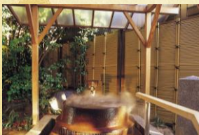
滝見の湯屋(露天桶風呂)