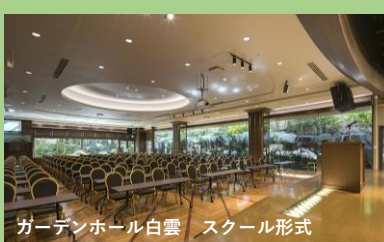
ガーデンホール白雲 スクール形式