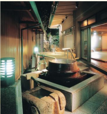
九谷の湯処(露天五右衛門風呂)