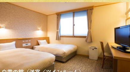
白雲の館 (洋室/ツインルーム)