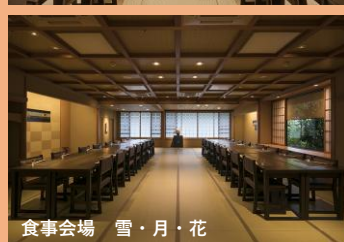
食事会場 雪・月・花