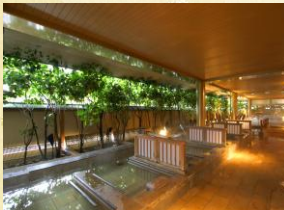
悠幻の湯殿(露天仕切湯)