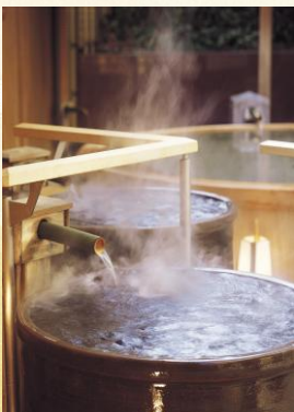
滝見の湯屋(かめ風呂)