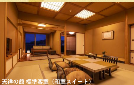
天祥の館 標準客室 (和室スイート)