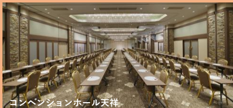
コンベンションホール天祥