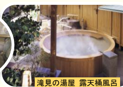
滝見の湯屋 露天桶風呂