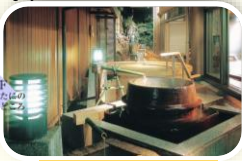
九谷の湯処 露天桶風呂

壁面の九谷焼を鑑賞し、日本庭園の眺めを満喫しながら入浴できます。桶風呂など露天風呂も充実しています