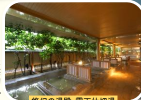
悠幻の湯殿 露天仕切湯

緑を配し広々とした露天風呂は幻想的な雰囲気。半身浴や寝湯が満喫できる仕切湯など個性的なお風呂が楽しめます